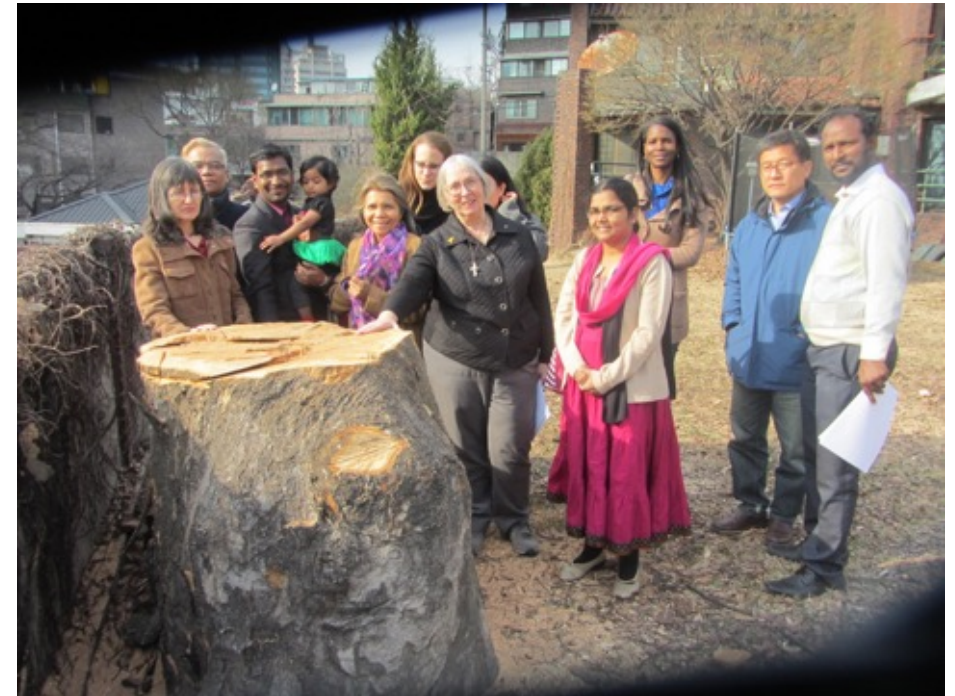
Unverständnis und Trauer

Coworker der Presbyterianischen Kirche aus 8 Ländern im Pfarrgarten nach der unüberlegten Abholzung eines 120 Jahre alten Baumes