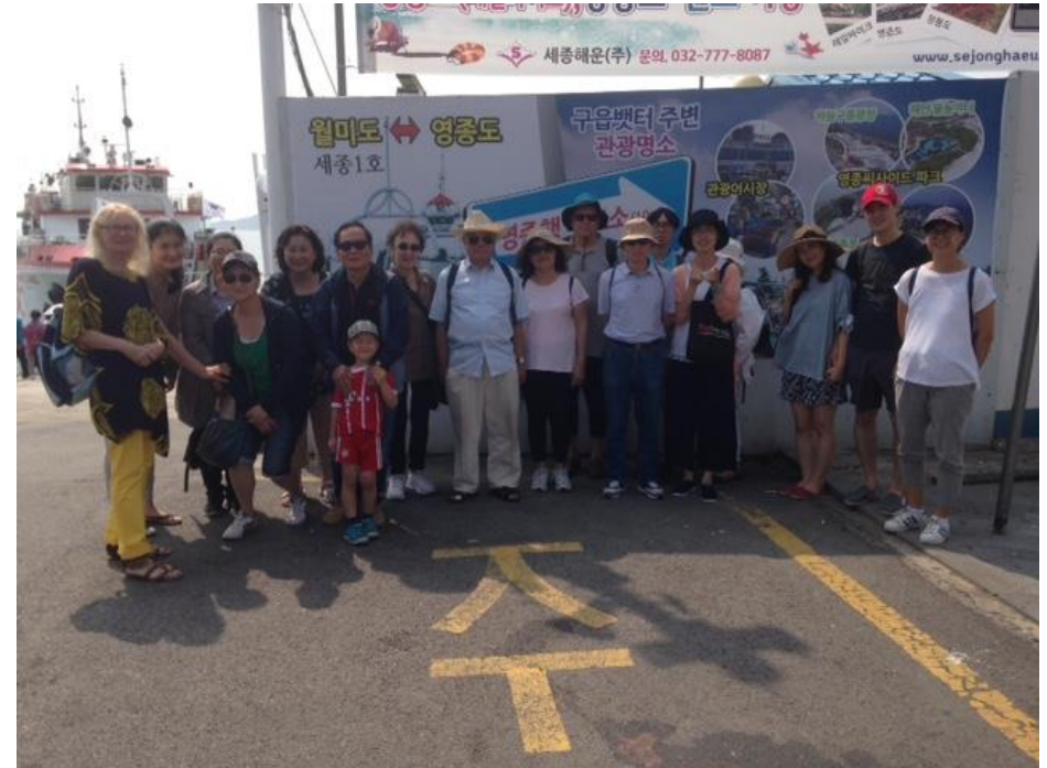
Ökumenischer Gemeindeausflug vom 23. Juni 2018 in Incheon